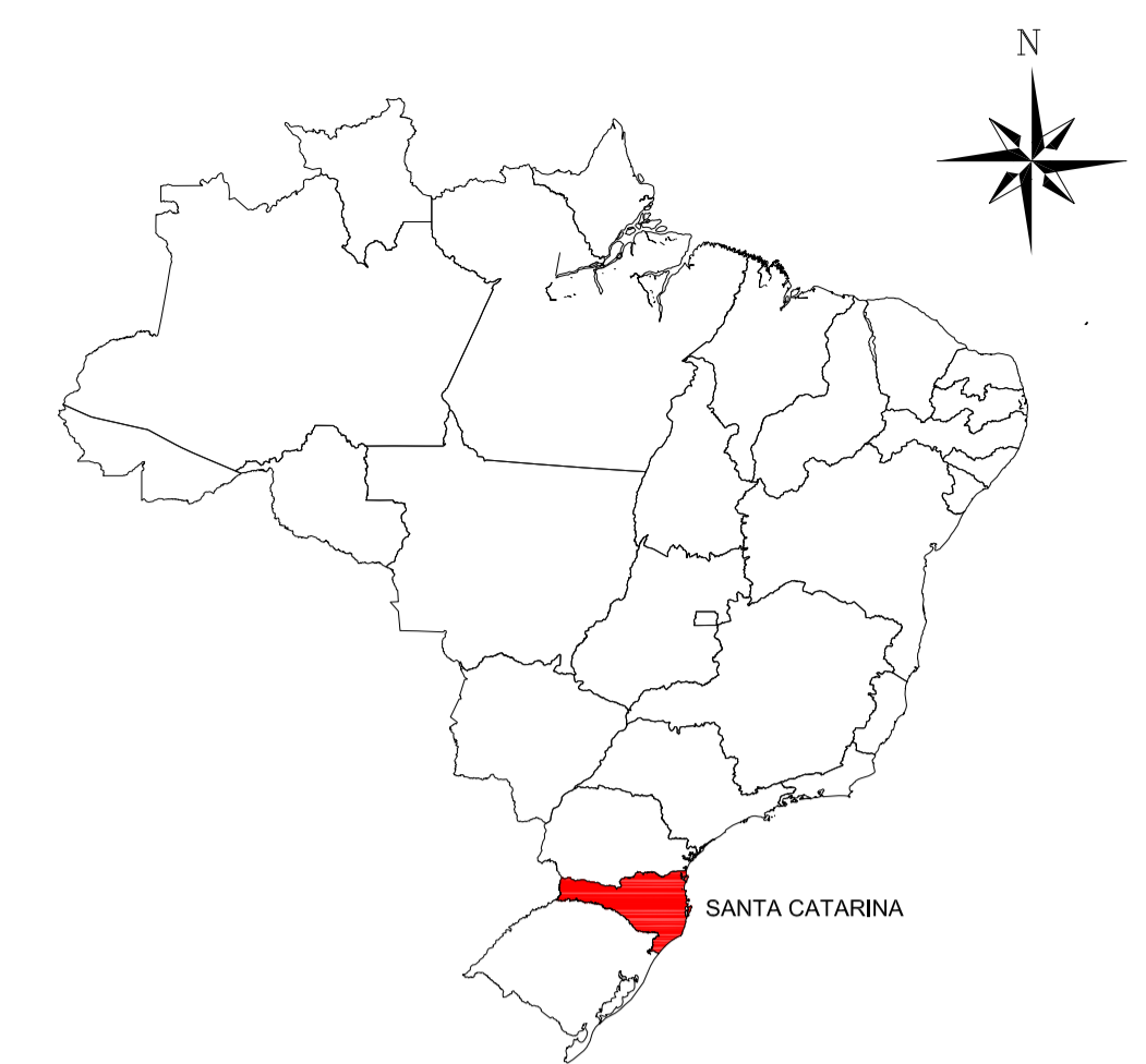
LOCALIZAÇÃO DO ESTADO S/ Escala